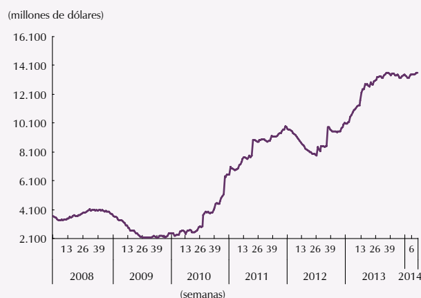
Gráfico 2 Total bancos Saldo con bancos del exterior