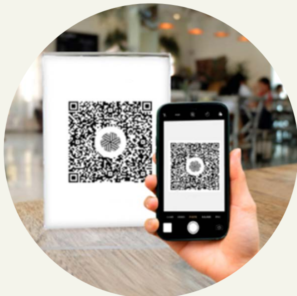
Imagen S1.1 Códigos interoperables (digital y físico)