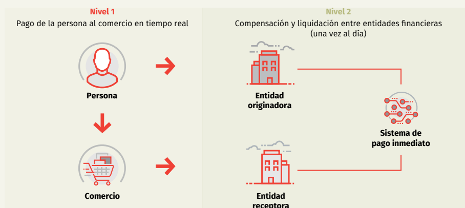
Diagrama S1.1 Operación de pago inmediato (dos niveles)