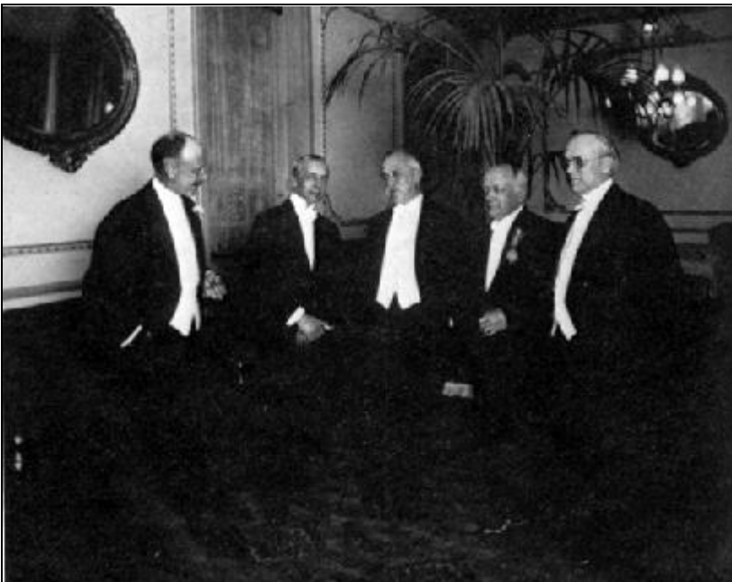
El presidente Pedro Nel Ospina (al centro), y el profesor E.W. Kemmerer (a su derecha), en 1923