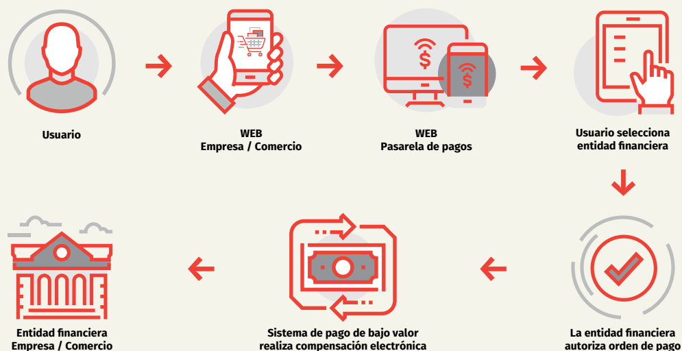
Diagrama R5.3 Flujo del proceso de pago con terceros como iniciadores