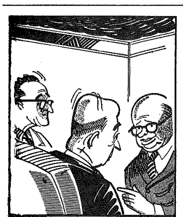
“REPARTIENDO LA POBREZA” Lleras a los Cafeteros -¿Pero de qué se quejan, si ustedes fueron los más favorecidos en este reparto?