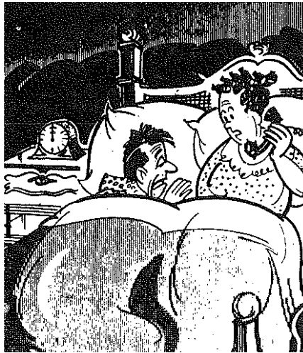
Llamada de Palacio