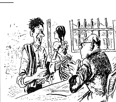
-Oí decir que iban a repartir la pobreza y vine a ver si querían empezar por repartir la mía