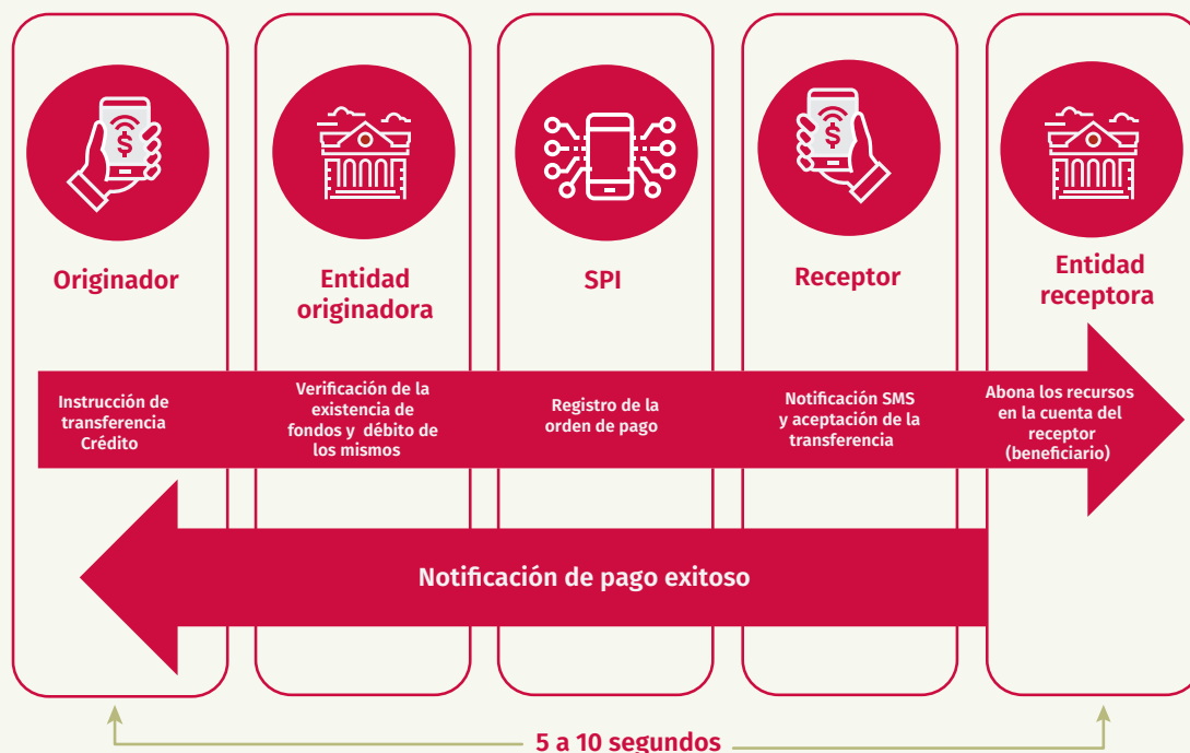
Diagrama A Flujo de un pago inmediato - Transfiya

El originador del pago ingresa desde su teléfono móvil a la aplicación de la entidad financiera en donde tiene su cuenta, y mediante el servicio de Transfiya digita el número del teléfono móvil del beneficiario (receptor) del pago, una descripción del mismo y el valor a transferir.