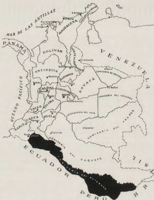
SITUACIÓN TERRITORIAL Y POLÍTICA DE LA COMISARÍA

SITIOS IMPORTANTES. — Sucre , de reciente fundación, situada en el valle de Sibundoy, en fácil comunicación con Pasto; está habitada exclusivamente por blancos. Mocoa , antigua capital de lo que fué territorio del Caquetá, que comprendía del Guaviare al Napo; tiene algunos cultivos; está enlazada con el sur del Huila por un camino nacional y dista de Bogotá 995 kilómetros y de Pasto 180. Se halla a 638 metros de altura y su temperatura media es de 27° centígrados. Tiene 11,600 cafetos. Sibundoy o Sebondoy , en el hermoso valle al que ha dado su nombre; tiene algunos cultivos y en sus dehesas prospera el ganado. Este valle está anegado en su mayor parte por una represa del río. Los indios hablan el cocha , que parece ser corrupción del chibcha. Santiago y San Andrés , son dos pueblos enteramente de indígenas, que descienden de los Incas del Perú, y hablan el inca. San Francisco , pueblo de blancos en el Valle de Sibundoy. Puerto Limon , es el puerto de Mocoa, sobre el río Caquetá. Puerto Umbría , sobre el Putumayo, cercano al antiguo Puerto Sofía; de ahí se puede bajar a Puerto Asís en canoa. Puerto Asís , sobre el Putumayo. Caucaya , colonia penal fundada a orillas del Caucaya, pequeño afluente del Putumayo. Tiene algunos cultivos.