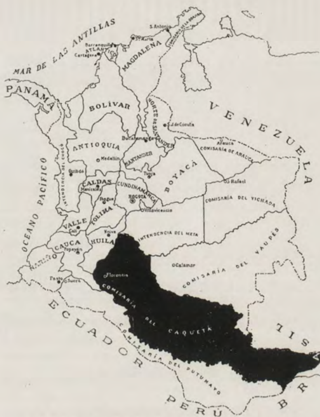
SITUACIÓN TERRITORIAL Y POLÍTICA DE LA COMISARÍA

La extracción del caucho principia en octubre cuando ha entrado la estación seca. La primera operación del cauchero es practicar varias exploraciones en las selvas sin alejarse mucho de los ríos o caños navegables, hasta encontrar una buena mancha de 4 a 5 mil árboles; en seguida procede a una pequeña roza, donde levanta la barraca para albergarse con su familia y los peones, casi siempre indios de la región. Procede luego a marcar los árboles, a limpiarlos de las malezas y a abrir trochas. Después viene el amarre de los árboles con tiras de moriche de 3 a 4 metros de largo; estas tiras abrazan el tronco y tienen un doblez especial por donde corre el látex.