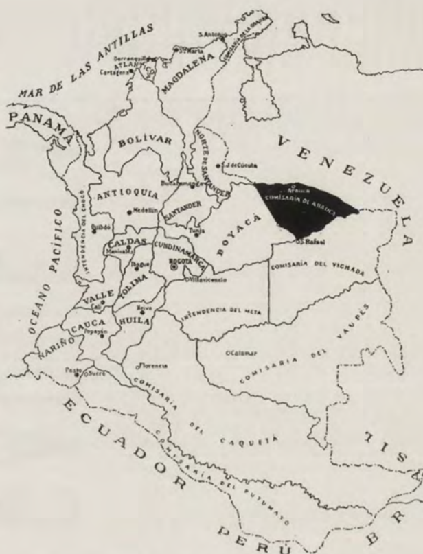
SITUACIÓN TERRITORIAL Y POLÍTICA DE LA COMISARÍA

En toda la comisaría funcionan escuelas y en ella dirigen los PP. Lazaristas una misión erigida en Prefectura Apostólica que comprende además parte de los llanos pertenecientes a Boyacá. Los centros principales de esta Prefectura, son: Tame, Arauca, La Salina y Cravo.