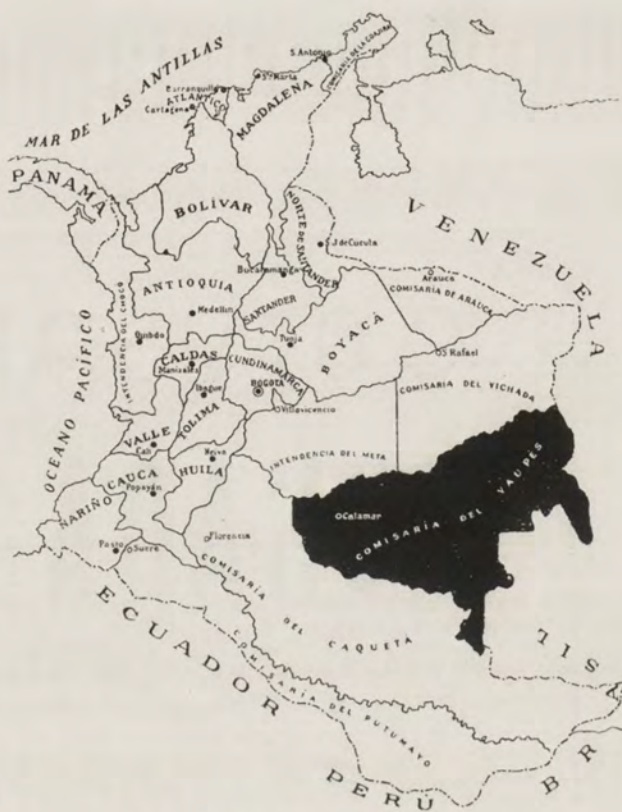
SITUACIÓN TERRITORIAL Y POLÍTICA DE LA COMISARÍA