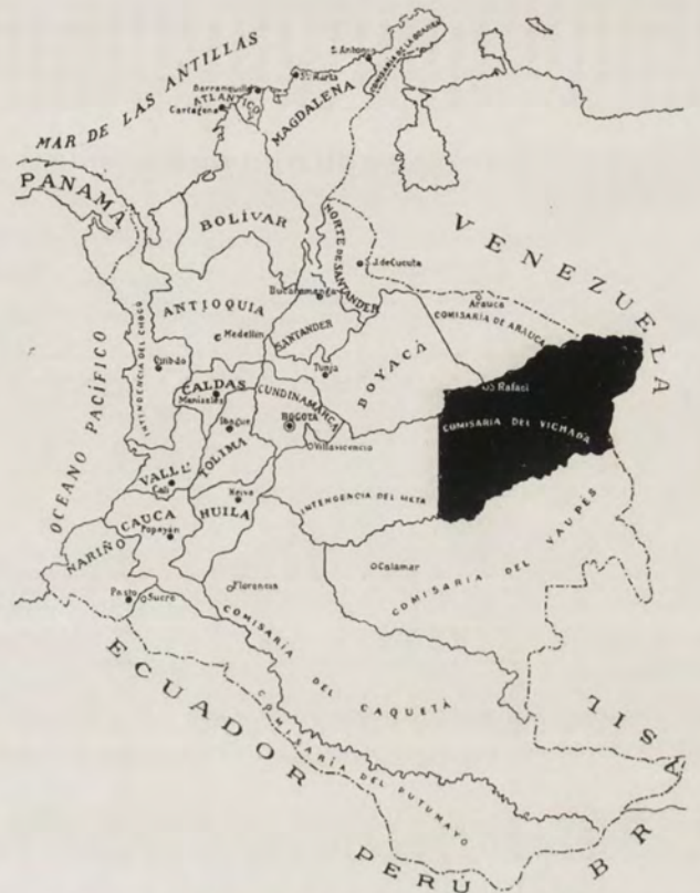
SITUACIÓN TERRITORIAL Y POLÍTICA DE LA COMISARÍA

La escasa población blanca de la comisaría se dedica, como queda dicho, a la industria ganadera y a la agrícola, sólo para atender a las necesidades de los pocos moradores de esas comarcas. Entre los productos de esta última figuran el maíz, la yuca amarga, utilizada en la fabricación de la torta llamada casabe y en la del mañoco o tapioca , productos éstos que obtienen mercado en las poblaciones venezolanas limítrofes a la comisaría.