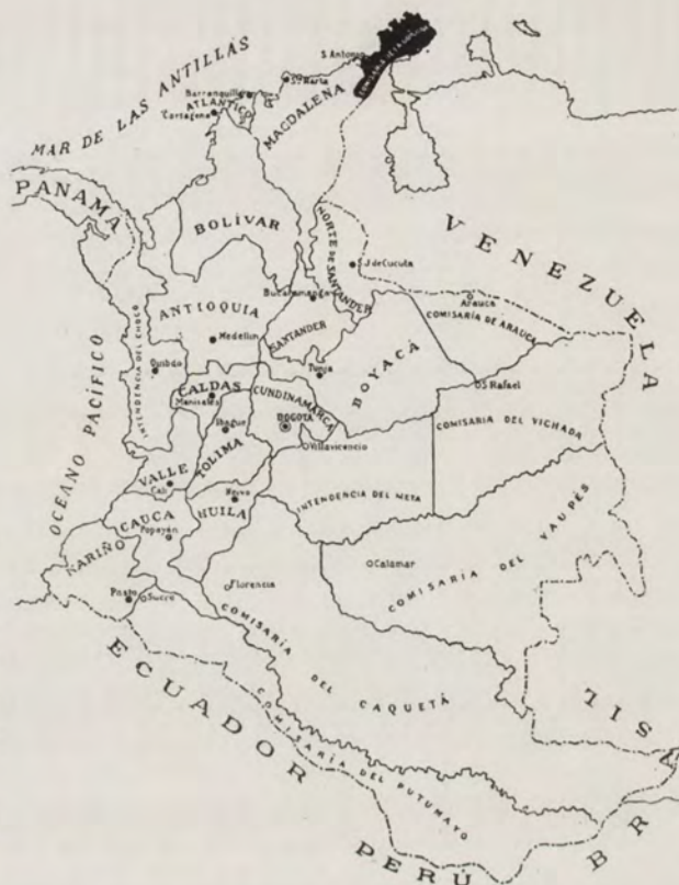
SITUACIÓN TERRITORIAL Y POLÍTICA DE LA COMISARÍA

ALTURAS. — Los puntos de mayor importancia son: desde el punto de vista de su elevación el Cerro de La Teta y el Cerrajón; hay otros lugares como el pico alto de Macuira, las elevaciones de Carpintero, los Cerros de las Palmas cerca de Pañasira en el límite con Venezuela, Punta Espada y Cabo de la Vela.