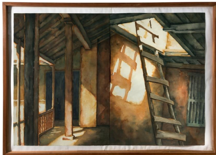
Teresa Perdomo (1995) Escisión (pintura, acuarela y gouache)