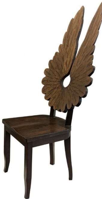
Pedro Ruiz (1999) Ave Auxiliar (Escultura tallada en madera)