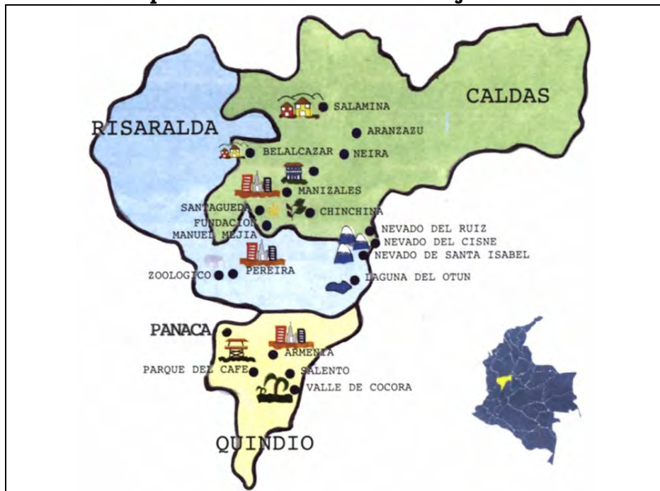
Mapa 7 Principales centros turísticos del Eje Cafetero