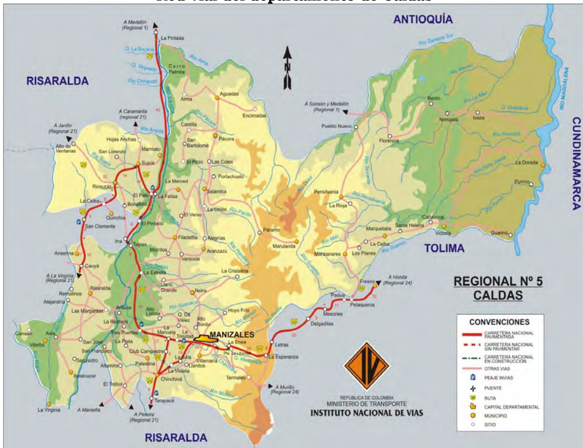
Mapa 1 Red vial del departamento de Caldas