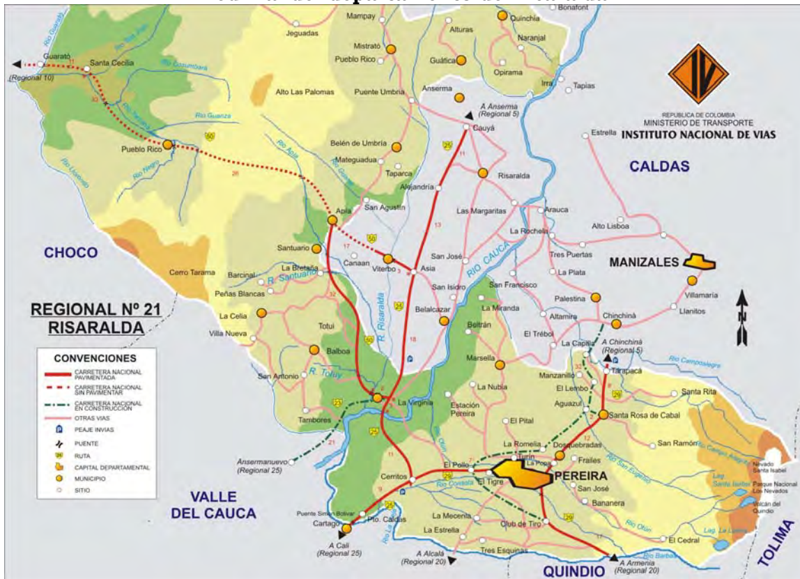
Mapa 3 Red vial del departamento de Risaralda