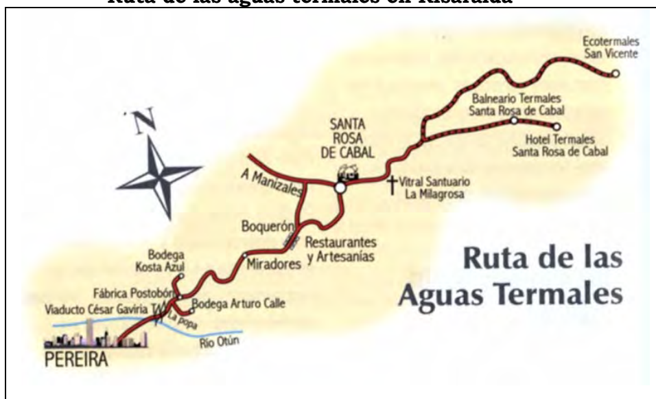
Mapa 6 Ruta de las aguas termales en Risaralda