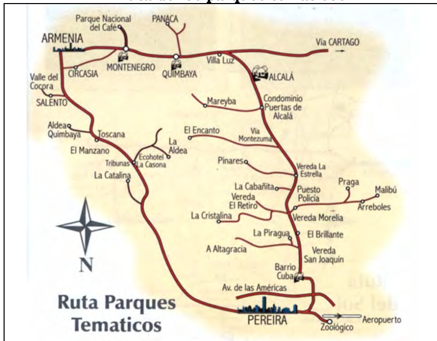
Mapa 5 Ruta de los parques temáticos