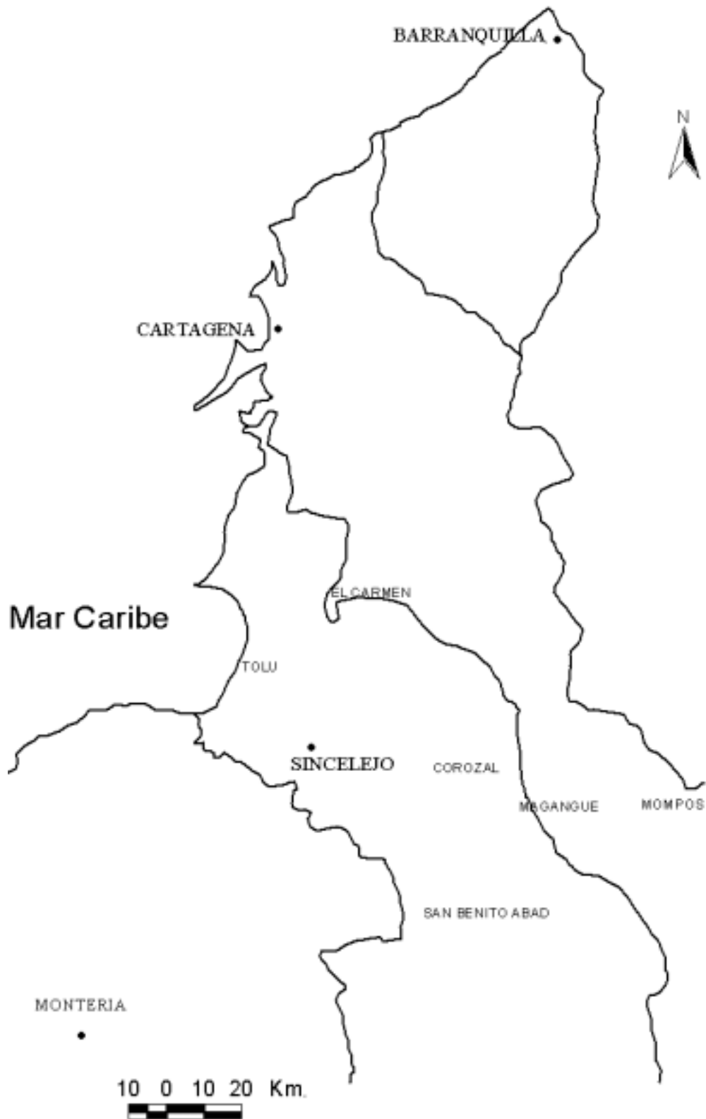
Mapa 1 Ubicación de Sincelejo en la región Caribe