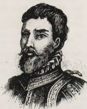
GONZALO JIMÉNEZ DE QUESADA