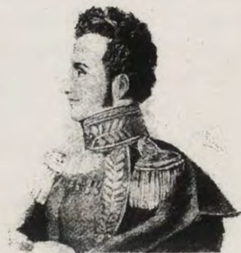
ANTONIO JOSÉ DE SUCRE, GRAN MARISCAL DE AYACUCHO

El triunfo de los republicanos en Boyacá, al impulso de Bolívar; el acto del Congreso de Angostura en 1819 al declarar constituida la Nación con los territorios de las actuales repúblicas de Colombia y Venezuela; la libertad del Istmo de Panamá, alcanzada por sus propios hijos dos años después; la libertad de Quito, conseguida por las armas victoriosas de los colombianos; la incorporación de Guayaquil en 1821; y la libertad de Bolivia y el Perú en