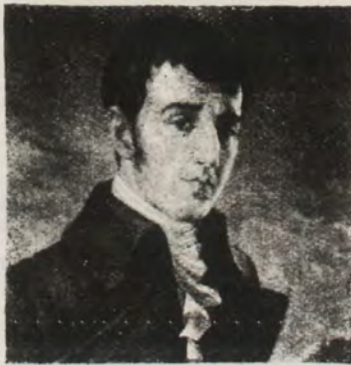
FRANCISCO JOSÉ DE CALDAS