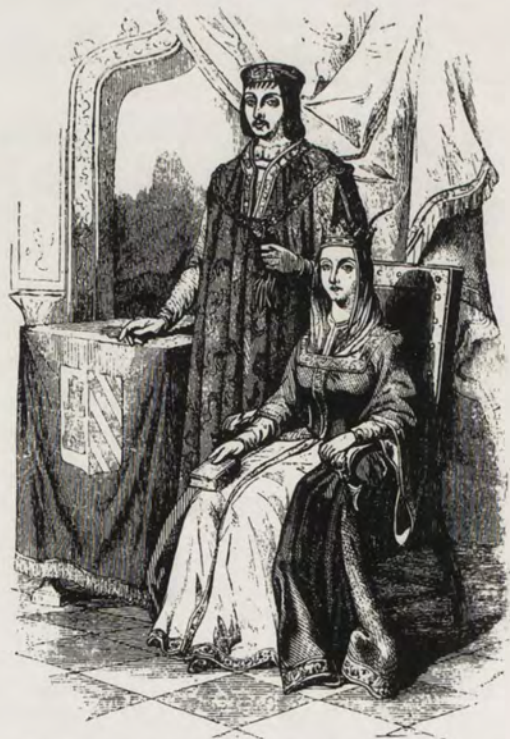
LOS REYES CATÓLICOS DE ESPAÑA, DON FERNANDO Y DOÑA ISABEL

Desde antes de la Conquista, como queda dicho, el territorio de la que vino a ser República de Colombia, estaba ocupado por tribus de indígenas de la gran familia de los Caribes que ocupaban diversas regiones. Entre las más importantes figuraban: