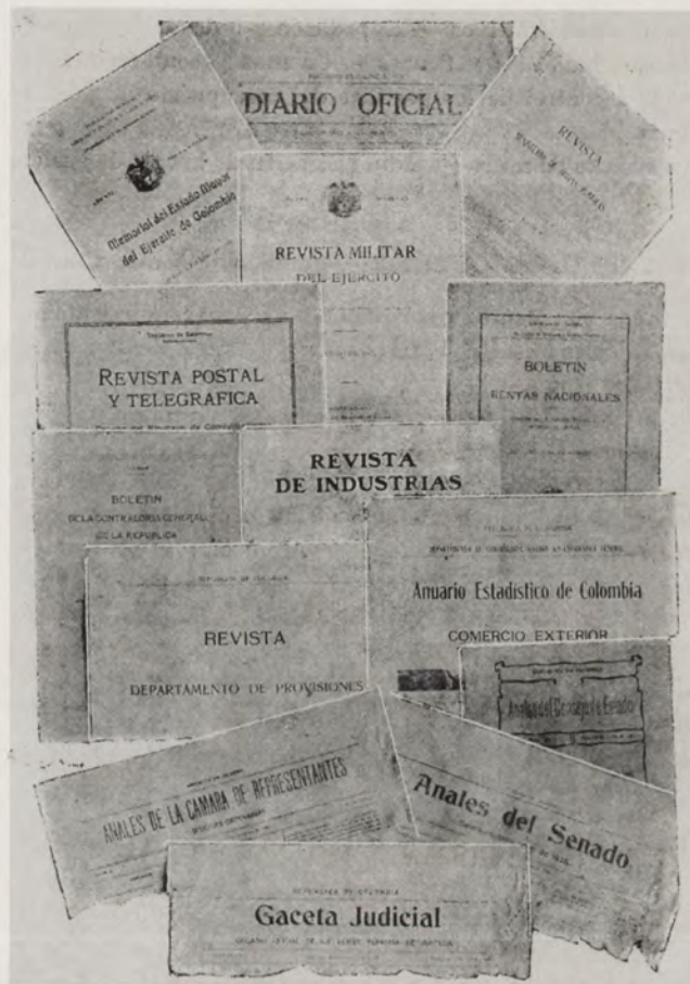
PRENSA DE LOS PODERES PÚBLICOS NACIONALES

Pesas y medidas. — Registro de marcas. — Patentes de invención. — Compañías de seguros. — Legalización de Compañías extranjeras.