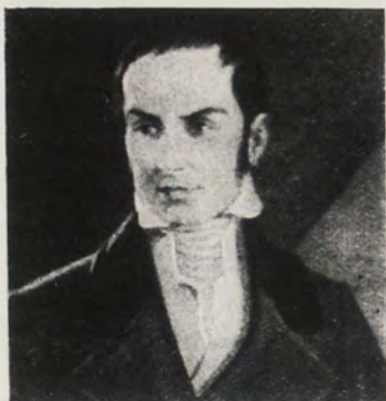
CAMILO TORRES. CEREBRO DEL MOVIMIENTO REVOLUCIONARIO DE 1810

venidos del Norte, traían como único objetivo el de procurar la libertad de los granadinos. Entonces empezó la guerra de grandes fatigas, privaciones, sacrificios y penalidades.