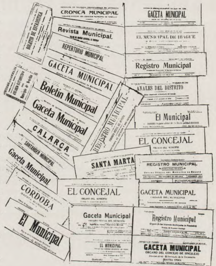
Prensa Oficial Municipal

tiene caseríos de alguna importancia, en los cuales conviene establecer una administración especial, se erigen en corregimientos, los cuales son administrados por un funcionario llamado Corregidor, que ejerce sus funciones bajo la dependencia del Alcalde y de acuerdo con las instrucciones de éste.