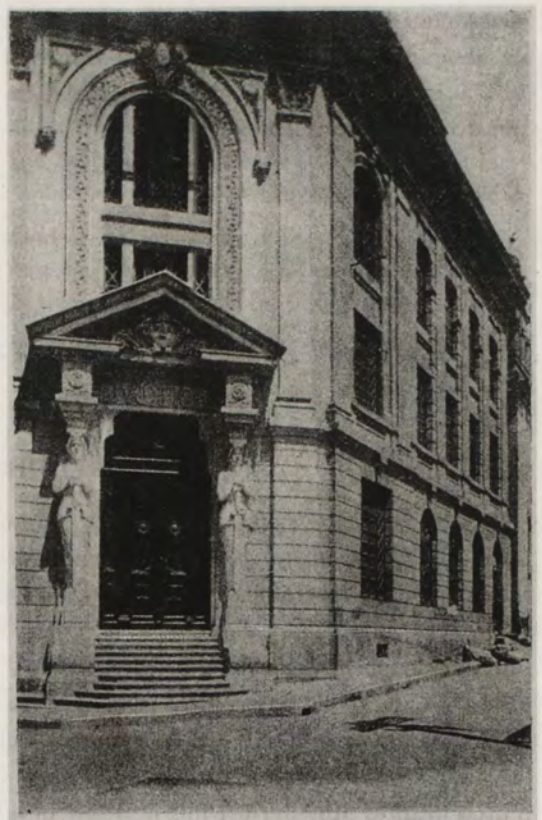
PALACIO DE JUSTICIA

La Corte Suprema de Justicia, en Sala Plena, decide definitivamente sobre la exequibilidad de los