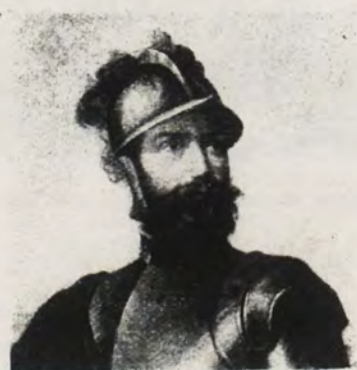
SEBASTIÁN DE BELALCÁZAR