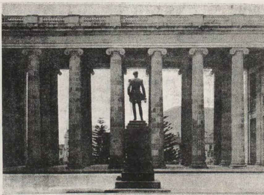
INTERCOLUMNIO DEL CAPITOLIO NACIONAL.

SECCIÓN SEGUNDA. — RAMO DE PRISIONES. — Asuntos relativos al ramo de prisiones con excepción de los contratos.