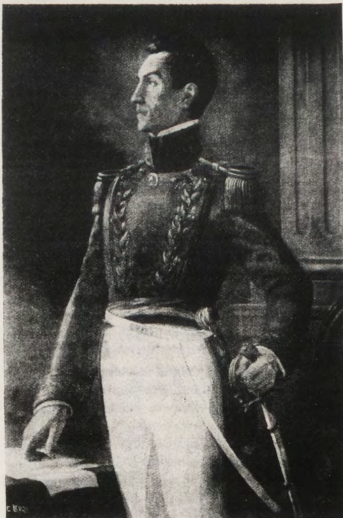
SIMÓN BOLÍVAR, LIBERTADOR DE CINCO REPÚBLICAS Y PADRE DE LA PATRIA COLOMBIANA