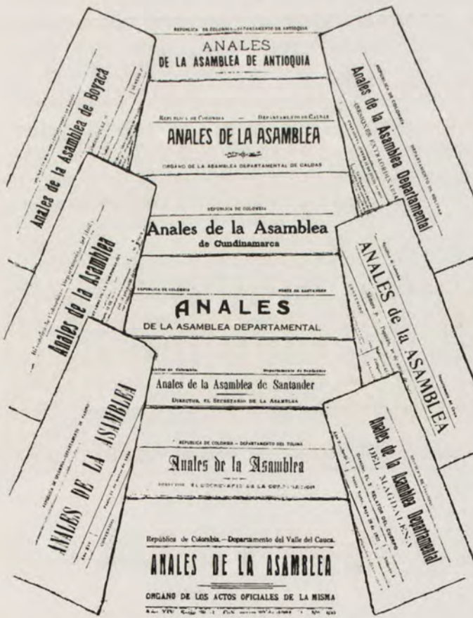
Órganos de las Asambleas Departamentales

ASAMBLEAS DEPARTAMENTALES. — En cada departamento funciona una Asamblea Departamental, corporación de origen popular, establecida como cuerpo administrativo de los intereses departamentales, para lo cual tiene amplios poderes constitucionales y legales, para así poder dirigir y reglamentar todo lo concerniente a la existencia y desarrollo del departamento. La Asamblea establece contribuciones para cubrir los gastos departamentales; organiza el manejo de las rentas; expide el presupuesto de rentas y gastos para cada año fiscal; reglamenta los esta-