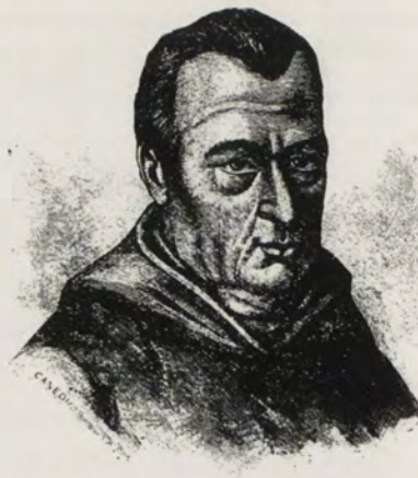
CANÓNIGO JOSÉ CELESTINO MUTIS

GOBIERNO DE LOS PRESIDENTES. — La Corte Española dispuso en 1564, en vista del resultado poco satisfactorio que daba la forma de gobierno anteriormente establecida, crear el puesto de Presidente , individuo investido de autoridad civil y militar y que presidía el tribunal de la Audiencia. La presidencia se ejerció desde 1534 hasta 1718, por veintidós magistrados, así: