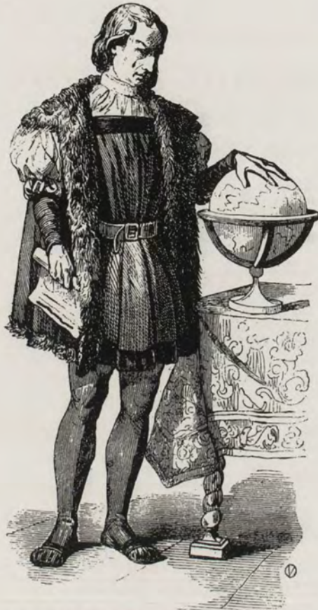
CRISTÓBAL COLÓN, DESCUBRIDOR DE AMÉRICA