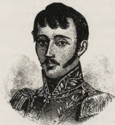
JOSÉ ANTONIO ANZOÁTEGUI

Después de esta batalla, Bolívar siguió hasta Santa Fé adonde llegó triunfante el 10, y encontró que desde la víspera el último mandatario del Rey Fernando, los oídos de la Audiencia, los empleados, los españoles europeos y todos los realistas se habían puesto en camino en gran confusión. Un pánico semejante, por el triunfo de las armas republicanas, se apoderó de los demás gobernantes españoles en las provincias que rápidamente abandonaron. Durante la epopeya eman-