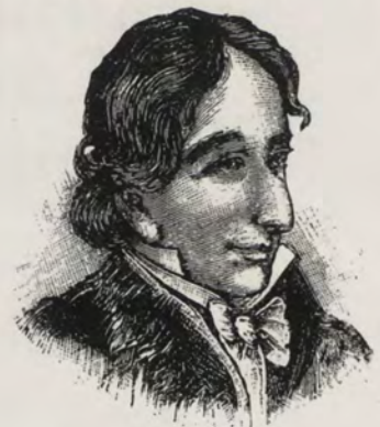
FRANCISCO ANTONIO ZEA

En esa misma época, en el año de 1563, se estableció la silla ar-