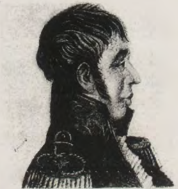
ANTONIO NARIÑO, PRECURSOR DE LA INDEPENDENCIA NACIONAL

— En 1718, el monarca español resolvió establecer un mandatario revestido de mayor poder que el de Presidente, llamado Virrey , y bajo esta forma se gobernó el país por Antonio de la PEDROSA Y GUERRERO en 1718, y por Jorge VILLALONGA en 1719. En 1724 nuevamente se volvió al régimen de los Presidentes, el que subsistió hasta 1739, siendo entre ellos: