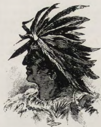
UN ZIPA, SOBERANO DE LOS CHIBCHAS

los Huitotos , Omagas , Vaupeses , en el Caquetá.