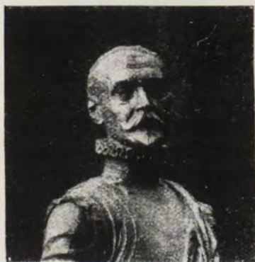
RODRIGO DE BASTIDAS