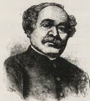
GENERAL JOSÉ ANTONIO PÁEZ

cipadora, larga y cruel, todos los americanos lucharon con valor, abnegación, entereza y heroísmo. Los nombres de aquellos patriotas están esculpidos con grato afecto en el corazón del pueblo colombiano para rendir culto a su memoria, como padres de la patria y progenitores de la nacionalidad.