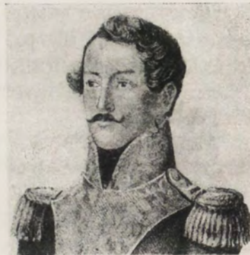
FRANCISCO DE PAULA SANTANDER, EL HOMBRE DE LAS LEYES, Y ORGANIZADOR DE LA VICTORIA

de julio de 1819 en el Pentano de Vargas , fueron preparando la jornada decisiva del 7 de agosto en el campo inmortal de Boyacá, a donde los españoles se rindieron y entregaron las armas, quedando en tan gloriosa acción abolido para siempre el dominio español en el territorio de la Nueva Granada.