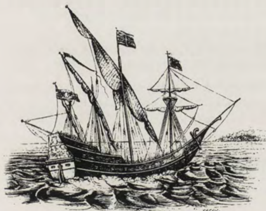
CARABELA «SANTA MARÍA» EN LA CUAL HIZO COLÓN SU PRIMER VIAJE

los Chibchas o Muisca , en la Sabana de Bogotá;