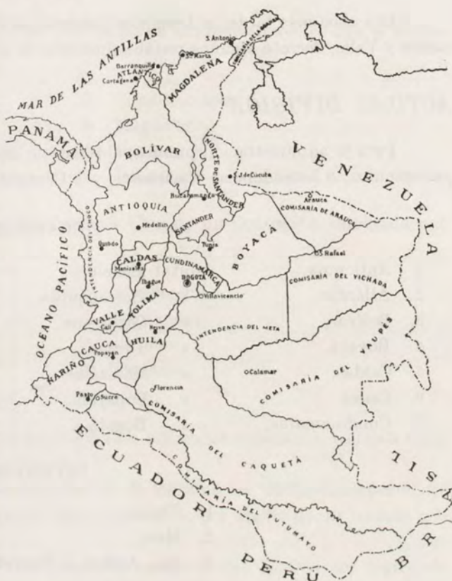
DIVISIÓN POLÍTICA Y ADMINISTRATIVA

GOBERNADORES. — En cada Departamento hay un Gobernador, funcionario nombrado por el Presidente de la República de quien es Agente y representante, al mismo tiempo que el Jefe de la administración seccional. Corresponde al Gobernador: hacer que se cumplan en el departamento la constitución, las leyes, las ordenanzas, los acuerdos municipales y las órdenes del Gobierno; dirigir la acción administrativa, nombrando y separando libremente sus agentes; nombrar en propiedad los notarios y los registradores de instrumentos públicos, de ternas